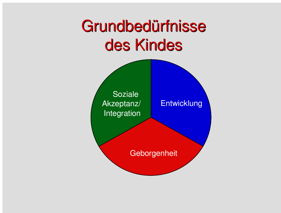
Abbildung 1. Zürcher Fit Modell.

Diese Forderungen gelten prinzipiell für alle Kinder, normal entwickelte, behinderte, akut und chronisch kranke Kinder (Largo 2002). Es sind die Grundbedürfnisse eines jeden Kindes. Beim chronisch kranken Kind müssen unsere Bemühungen so ausgerichtet sein, dass sie der langfristigen Beeinträchtigung Rechnung tragen. Diese Forderungen der WHO entsprechen dem Zürcher Fit Modell, welches die Bedürfnisse eines Kindes in drei Bereichen definiert: Bei der Geborgenheit, der sozialen Akzeptanz und in der Entwicklung.